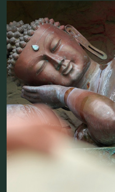
Der Nirwana-Buddha – die größte liegende aus Bronze gegossene Buddhastatue außerhalb Asiens